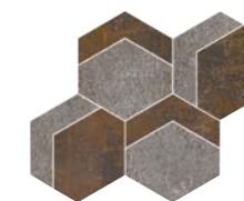
ESAGONO 2 18"x15.3"