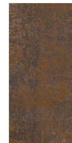
LAMIERA 12T 24"x48"

GRES PORCELLANATO PORCELAIN TILES - GRÈS CÉRAME - GLASIERTES FEINSTEINZEUG PORCELÁNICO - КЕРАМОГРАНИТ ГЛАЗУРОВАННЫЙ 上釉仿石瓷磚