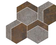
ESAGONO 2 45x39 - 18"x15.3"