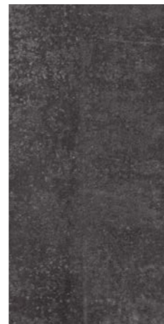
LAMIERA 12G 24"x48"

GRES PORCELLANATO PORCELAIN TILES - GRÈS CÉRAME - GLASIERTES FEINSTEINZEUG PORCELÁNICO - КЕРАМОГРАНИТ ГЛАЗУРОВАННЫЙ 上釉仿石瓷砖