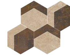
ESAGONO 1 45x39 - 18"x15.3"